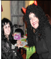
Petite sœur et Grande sœur!

La fête d'Halloween a connu un succès monstre! Les costumes étaient superbes! Les jeux de groupe, les sucreries ainsi que les tirages et la devinette 'jelly bean', sans oublier les beignets suspendus ont contribué à faire de ce moment un événement inoubliable!